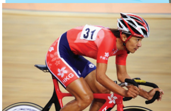
黃金寶 Wong Kam Po

香港單車代表隊運動員，專攻公路賽，1998年曼谷亞運、2006年多哈亞運、2010年廣州亞運公路賽金牌得主，3度獲取全國運動會公路賽金牌，2007年在西班牙，馬略卡場地單車世界錦標賽的15公里捕捉賽奪冠軍，首獲世界冠軍獲取彩虹戰衣。其後，在2008年洛磯山地場單車世界盃分站再獲捕捉賽冠軍，五度出征奧運。